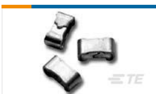
TE 产品编号1625854-3 0603 PROBE PAD