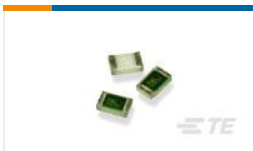
TE 产品编号1879417-8 CPF0603 1M0 0.1% 25PPM 5K RL