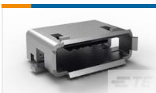
TE 产品编号1981584-1 MICRO USB, TYPE A/B, GRAY