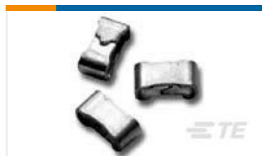
TE 产品编号1625854-4 1206 PROBE PAD