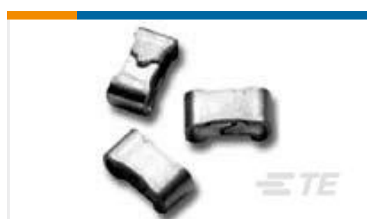
TE 产品编号1625854-2 0805 PROBE PAD