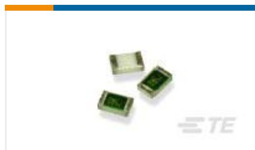
TE 产品编号1879208-1 CPF 0402 10R 0.1% 25PPM 1K RL