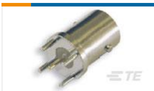
TE 产品编号5-1634503-1 BNC Str PCB Skt 50Ohm Nickel Pltd