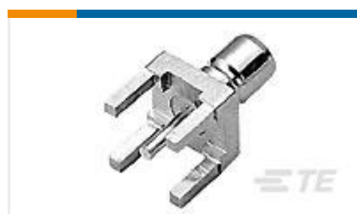
TE 产品编号1-1337482-0 SMB Str PCB Skt 50Ohm Gold Plt