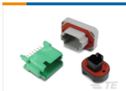
TE 产品编号DT15-12PD-B016 DEUTSCH DT 接头