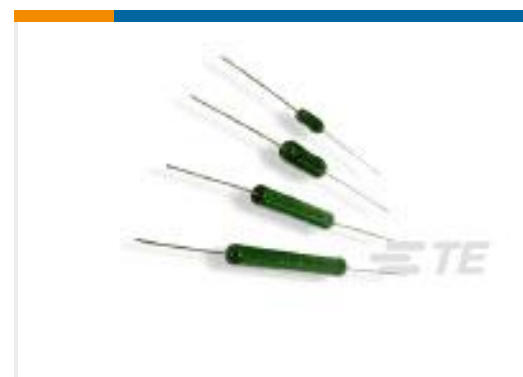
TE 产品编号2-1623774-2 C14 1R0 5% (LOOSE)