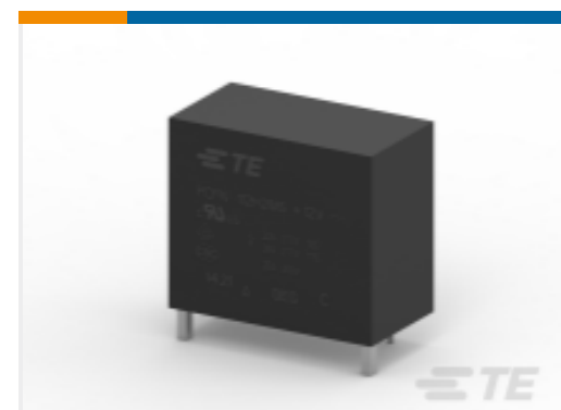
TE 产品编号1461410-3 PCFN 太阳能继电器