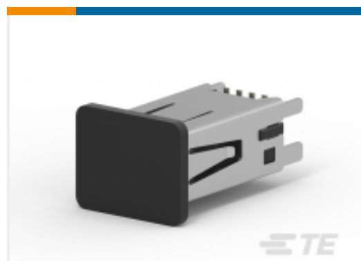
TE 产品编号2271656-2 Mini I/O 直式接头类型 2