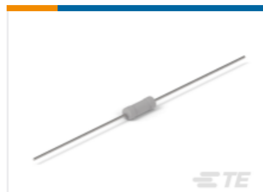
TE 产品编号3-1676123-9 1/2W SM M/OX 5% 33R