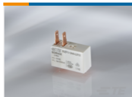
TE 产品编号1833011-1 STD SCHRACK RZF 功率继电器