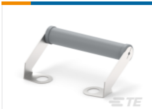
TE 产品编号1630184-5 放电式帽状电阻器 YP10