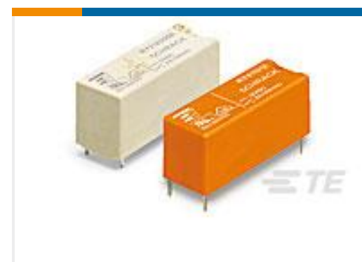
TE 产品编号5-1393224-2 RY212005