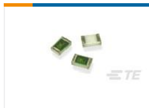
TE 产品编号1676218-2 RN 0805 1K02 0.1% 10PPM 1KRL