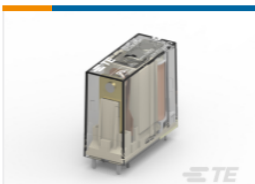
TE 产品编号1393230-7 RP3SL005