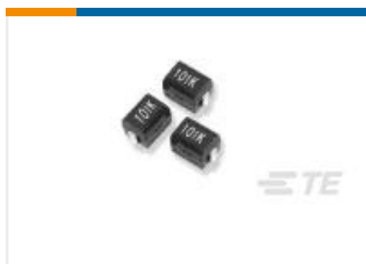
TE 产品编号1-1624094-3 3613C 33UH 10%