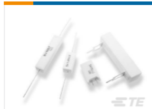
TE 产品编号1-1623783-4 线绕电阻器：垂直安装