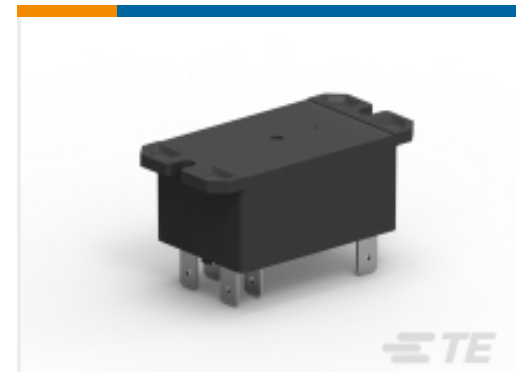
TE 产品编号6-1393211-6 PCB 功率继电器：40 Amp，单稳